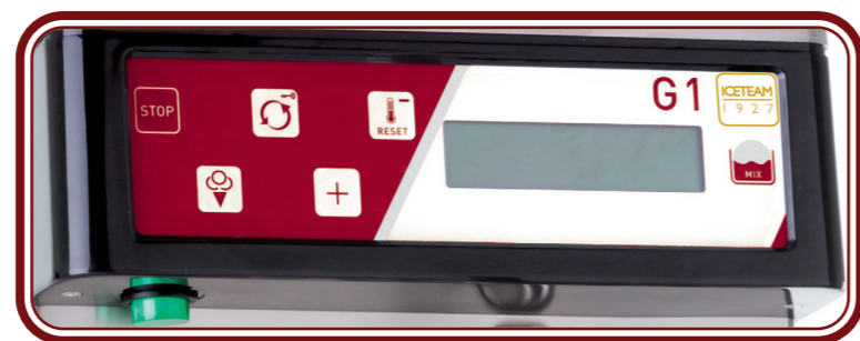
Display multilingua -Multilingual display